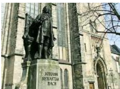
Estatua en memoria de Bach