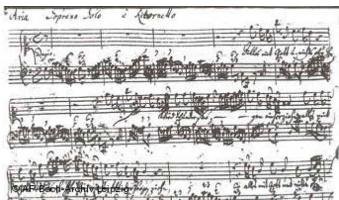
Partitura de Bach