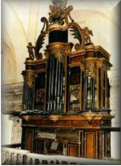
Organo de fuelles